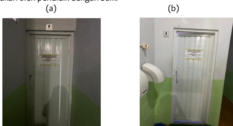
Gambar 1 a) Toilet anak Laki-laki, b) Toilet anak Perempuan

Berdasarkan paparan di atas dapat disimpulkan bahwa pelaksanaan pengenalan peran gender dalam pembelajaran pada anak usia 5-6 tahun di PAUD Al-Kindi Preschool Pangkalpinang sudah dilaksanakan oleh pendidik dengan baik.