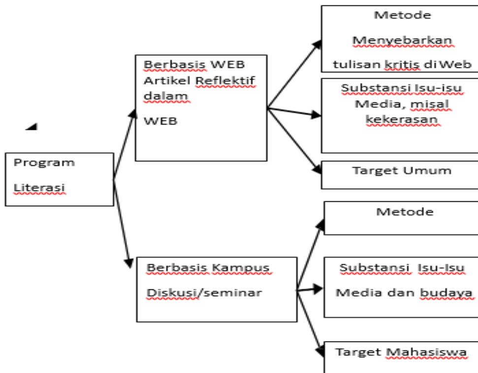
Gambar 3. Dua Jalur Model Literasi Media Remotivi

Berbagai gerakan literasi media di atas lebih banyak dilaksanakan pada lembaga-lembaga diluar besar dalam porsi pendidikan non formal. Pelatihan di lembaga swadaya masyarakat, diskusi, seminar, dapat dilakukan dengan maksimal dalam lingkup pendidikan non formal. Akhirnya, diharapkan dengan literate terhadap media sosial, masyarakat menjadi cerdas dalam memanfaatkan media tersebut dalam kehidupan sehari-hari.